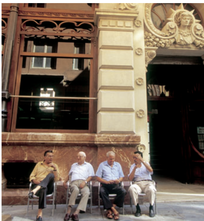
La Región de Murcia sufre un lento proceso de envejecimiento.